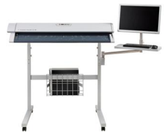
SC Xpress シリーズ専用 ユニバーサルスタンド