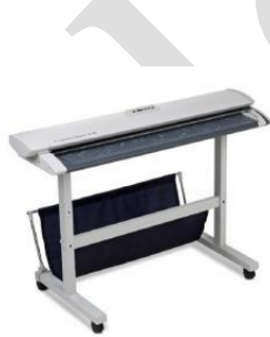
SC Xpress シリーズ専用スタンド (付属: 原稿受けバスケット)