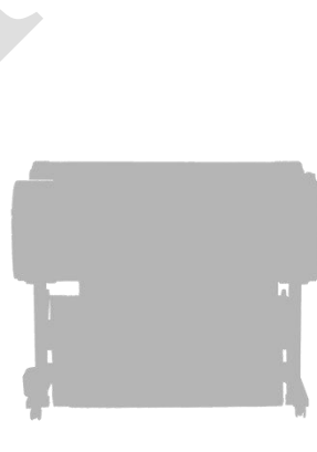
B0 サイズ対応プロフェッショナル MFP