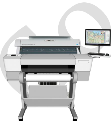
A1/A0 サイズ対応 MFP

※MFP システムのアップグレード価格は各スキャナ「導入後アップグレード価格表」の金額と同様です。