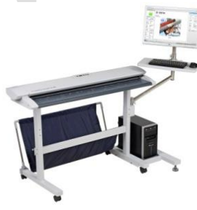
SC Xpress シリーズ専用スタンド +PC/モニタ搭載キット (付属: 原稿受けバスケット)